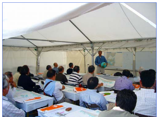
高槻氏による「海図の使い方」講習（3）