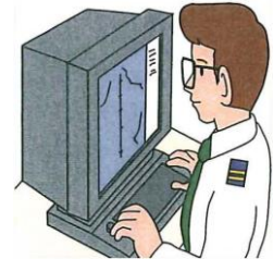
お客さま (ENC ユーザ)

ユーザパーミットは、ECDIS などの表示装置 1 台 1 台を識別するためのコードです。ECDIS 等を新規に購入した際、ECDIS メーカー等から必ず渡されます。