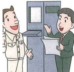
ECDIS メーカー 表示ソフトメーカーなど